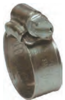
サニーホースバンド