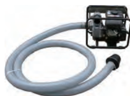
エンジン自給ポンプ