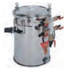
100Vミニバキューマー