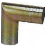
L型ホースニップル