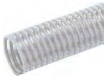
サクシオンホース