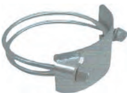
サクシオンホースバンド