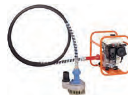
フレキポンプ(エンジンシャフトポンプ)