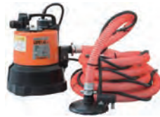
1"100Vオートスイープポンプ